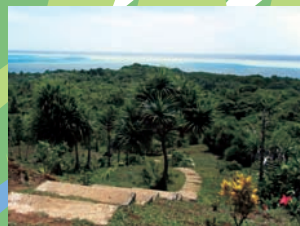
アルコロンストーンフェイス&モノリスの入り口。広々とした景色が見渡せます。