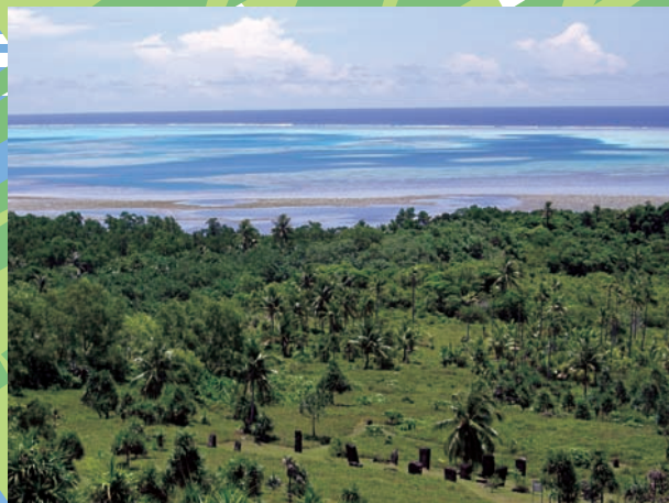
見晴らしの良いストーンフェイス&モノリスの丘。

バベルダオブ島内には10の州が有り、各々選挙により選出される州知事と、母系社会の中で選ばれ、代々受け継がれている「酋長」と呼ばれるリーダーがいます。