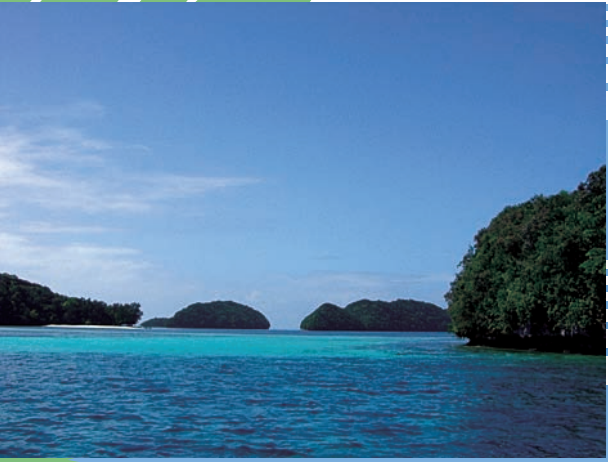
ロックアイランドを目指し、ベテランポートオペレーターがスイスイとロックアイランドを駆け抜けます。