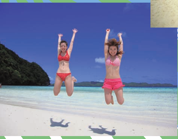
ロングビーチではまるで海の上を歩いているみたい。潮の満ち引きにより見えない場合もあります。