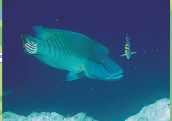
シュノーケリングでは透明な海の中の珊瑚や様々な魚たちを楽しみましょう。ナポレオンフィッシュが見れることもあります。